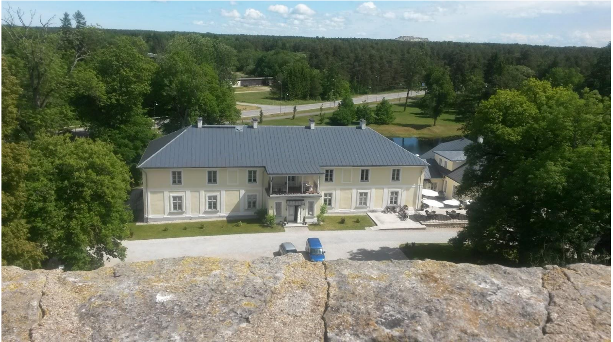
Joonis 1. Padise mõis. (Nelle Nurmela erakogu).